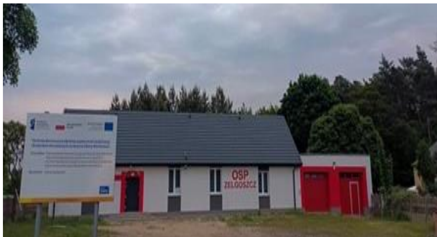
Zdjęcie 13. Budynek OSP Zelgoszcz

Docieplenie stropu, docieplenie ścian, docieplenie ściany na gruncie, wymiana drzwi zewnętrznych, wymiana okien drewnianych, Wymiana pojemnościowych podgrzewaczy elektrycznych na przepływowe podgrzewacze, Montaż paneli fotowoltaicznych wraz z opomiarowaniem, Roboty towarzyszące w tym: demontaż i ponowny montaż elementów zamontowanych na elewacji, wykonanie opaski wokół budynku, rozebranie schodów zewnętrznych i wykonanie nowych, remont daszków nad wejściami, wymiana instalacji odgromowej, demontaż obróbek blacharskich i wykonanie nowych, przemurowanie i remont kominów, demontaż i ponowny montaż krat wraz z ich wyremontowaniem.