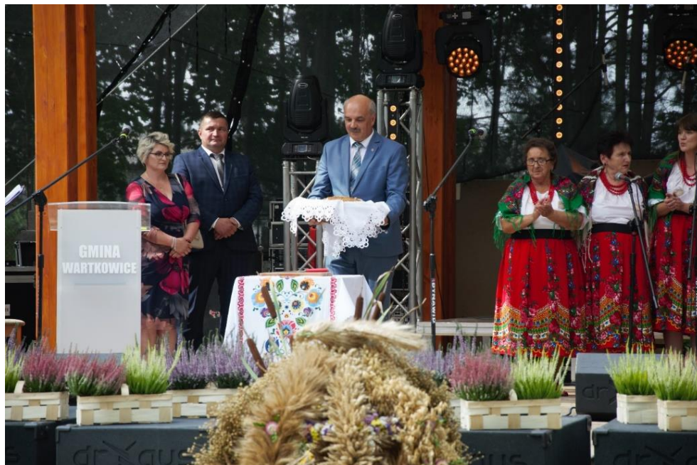
Zdjęcie 21. Dożynki Gminno-Parafialne 2022