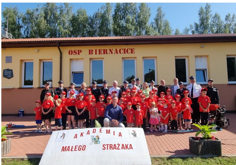
Zdjęcie 19. Ślubowanie członków Akademii Małego Strażaka w Biernacicach