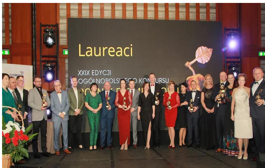
Zdjęcie 16. XXIX Edycja Ogólnopolskiego Konkursu Rolnik Farmer Roku

W uroczystości wzięli udział przede wszystkim rolnicy, przedstawiciele firm i instytucji obsługujących rolnictwo a także parlamentarzyści i ludzie nauki.