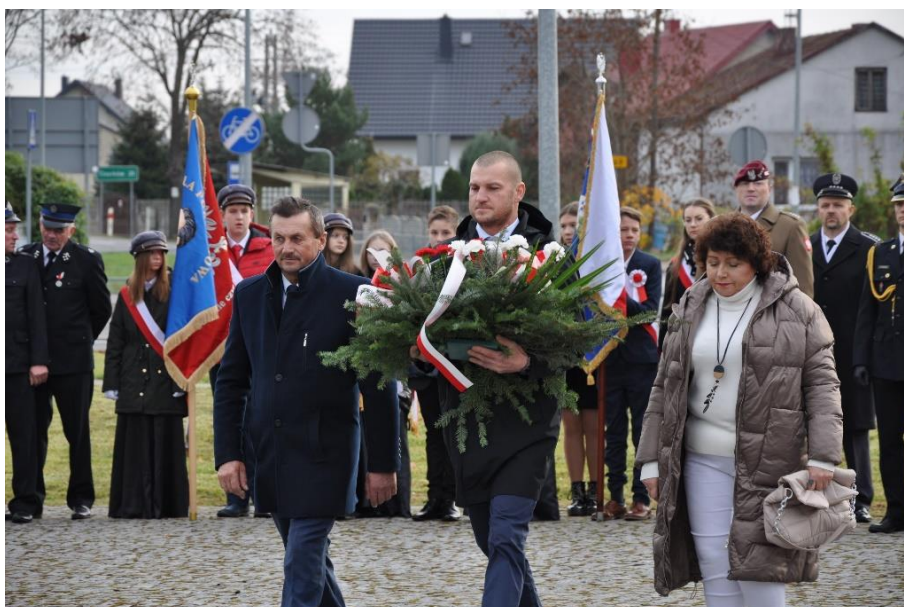
Zdjęcie 26. Złożenie kwiatów pod Obeliskiem w Starym Gostkowie