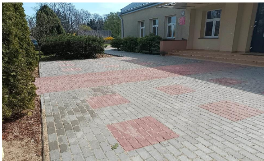
Zdjęcie 14. Nawierzchnia z kostki betonowej przed budynkiem Publicznego Przedszkola w Drwalewie

Zadanie zrealizowano w całości. Wartość wykonanych robót 94.776,99 zł. Kwota uzyskana z dofinansowania z PO „Rybacko i Morze” na lata 2014-2020 - 45.698,00 zł.