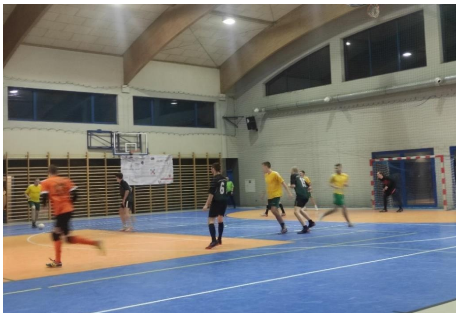
Zdjęcie 30. X Mistrzostwa Gminy Wartkowice w Piłce Nożnej Halowej 2021/2022