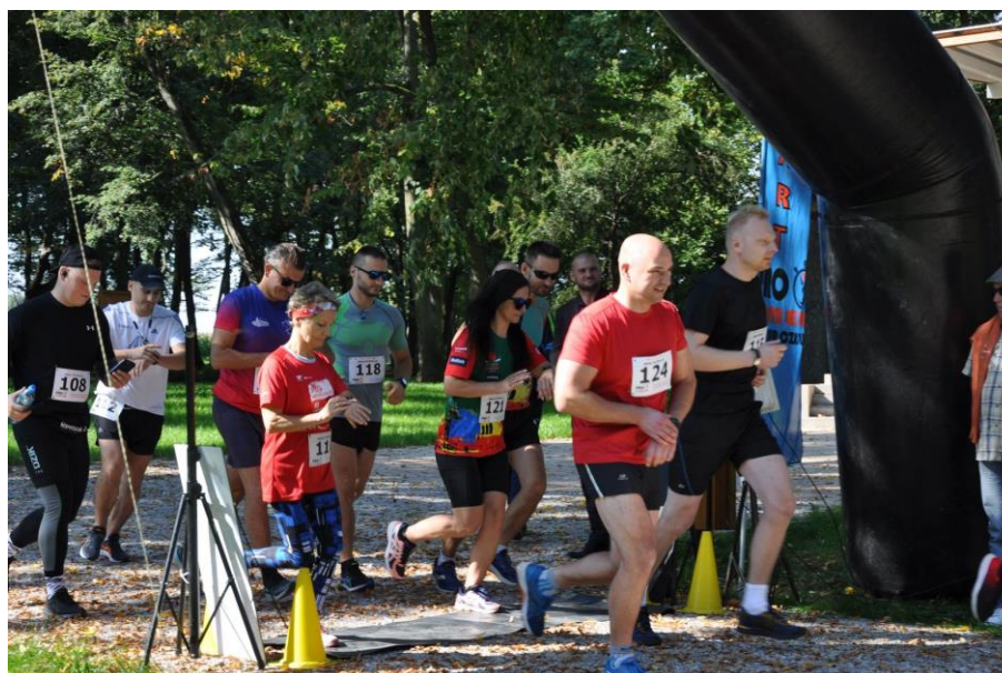
Zdjęcie 31. V Bieg Legionów Polskich