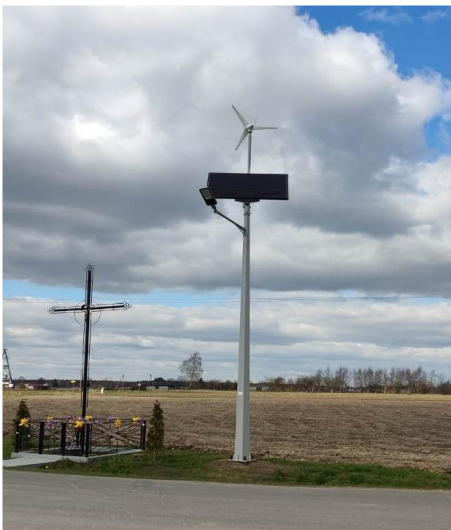
Zdjęcie 3. Oświetlenie uliczne - Wola Dąbrowa