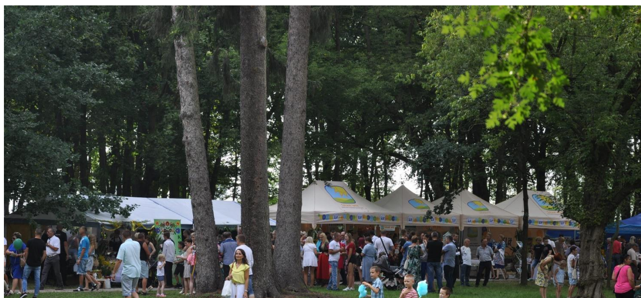
Zdjęcie 22. Dożynki Gminno-Parafialne 2022