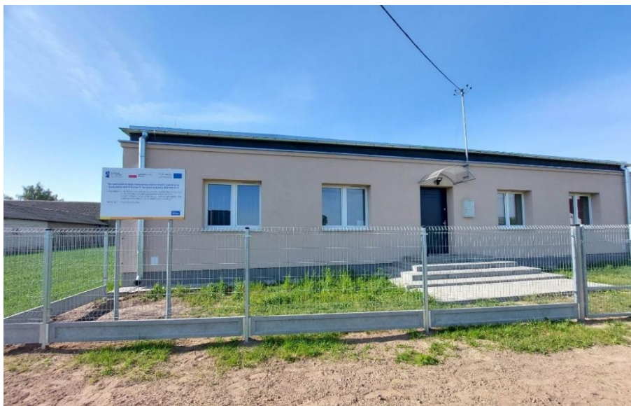
Zdjęcie 11. Dom Kultury w Polesiu

Docieplenie dachu, docieplenie ścian, docieplenie ściany na gruncie i docieplenie podłogi na gruncie, wymiana drzwi zewnętrznych, wymiana okien drewnianych, montaż instalacji fotowoltaicznej wraz z opomiarowaniem. Roboty towarzyszące w tym: demontaż i ponowny montaż elementów zamontowanych na elewacji, wykonanie opaski wokół budynku, rozebranie schodów zewnętrznych i wykonanie nowych, remont daszku wejściowego, wymiana instalacji odgromowej, demontaż obróbek blacharskich i wykonanie nowych, przemurowanie i remont kominów, demontaż i ponowny montaż krat wraz z wyremontowaniem.