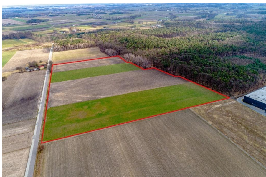
Zdjęcie 15. Teren inwestycyjny wprowadzony do bazy PAIH

Gmina Wartkowice posiada również Plan Zagospodarowania Przestrzennego na teren położony w obrębie Gostków, w sąsiedztwie zakładów JTI.