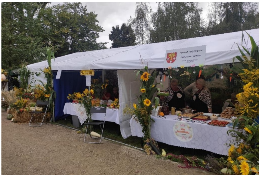
Zdjęcie 24. Wspólne stoisko Gminy Wartkowiec na Dożynkach Powiatu Poddębickiego w Zadzimiu