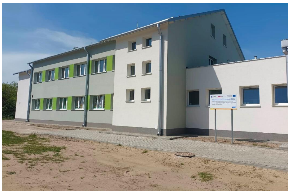
Zdjęcie 10. Budynek przedszkola z częścią mieszkalną w Drwalewie

Docieplenie dachu płytami warstwowymi, docieplenie ścian, docieplenie ściany na gruncie, wymiana drzwi zewnętrznych, wymiana okien drewnianych, montaż paneli fotowoltaicznych wraz z opomiarowaniem. Roboty towarzyszące w tym: demontaż istniejącej okładziny dachu, demontaż i ponowny montaż elementów zamontowanych na elewacji, wykonanie opaski wokół budynku, rozebranie schodów zewnętrznych i wykonanie nowych, demontaż i ponowny montaż daszków nad wejściami i jego odnowienie, wymiana instalacji odgromowej, demontaż obróbek blacharskich i wykonanie nowych, demontaż i ponowny montaż balustrad wraz z wyremontowaniem, przemurowanie i remont kominów, demontaż i ponowny montaż krat okiennych wraz z wyremontowaniem.