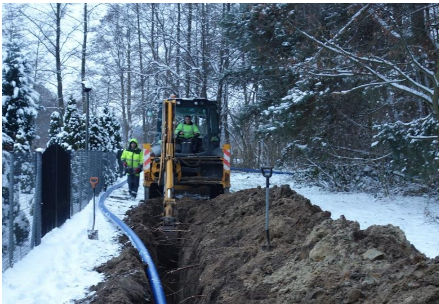
Zdjęcie 7. Budowa wodociągu Drwalew