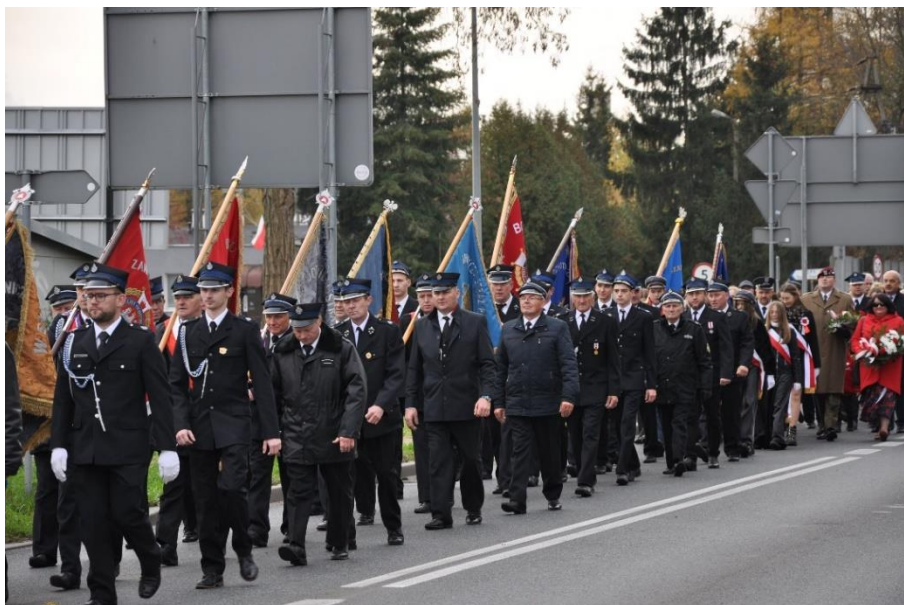
Zdjęcie 25. Gminne Obchody 104. Rocznicy odzyskania przez Polskę Niepodległości.