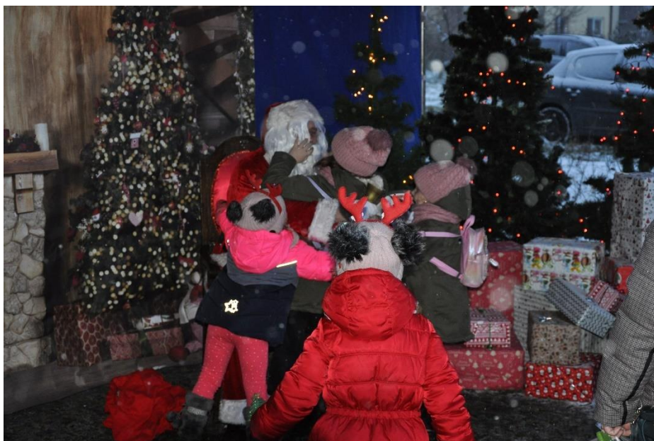
Zdjęcie 29. I Jarmark Bożonarodzeniowy – spotkanie z Mikołajem