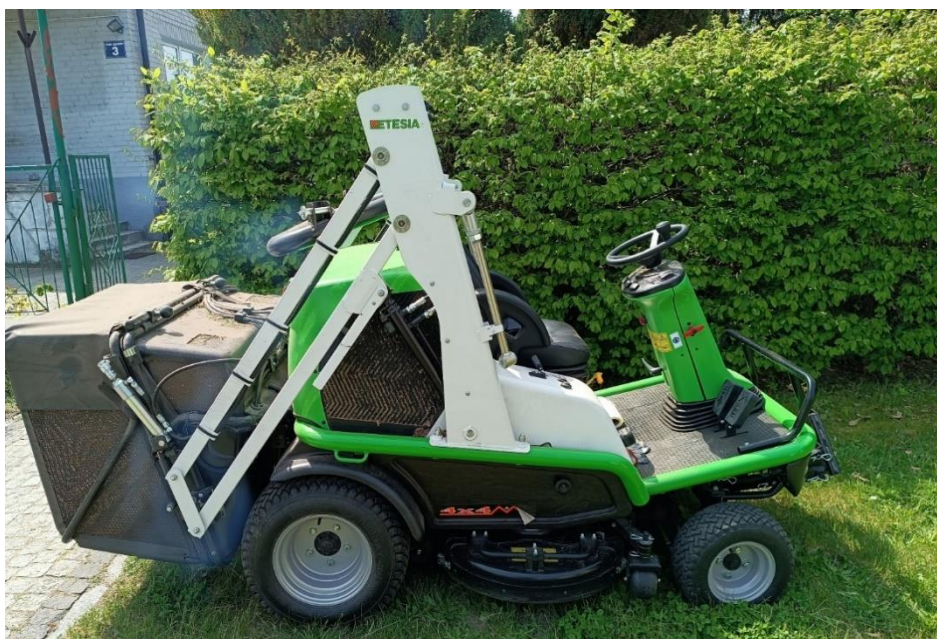
Zdjęcie 34. Kosiarka samojezdna z koszem samowyladowczym