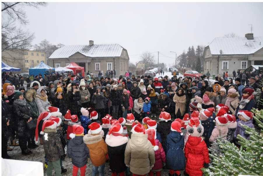
Zdjęcie 28. I Jarmark Bożonarodzeniowy – plac przed pałacem w Starym Gostkowie