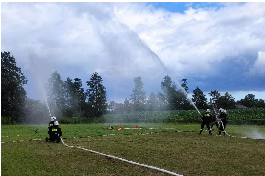
Zdjęcie 33. Gminne Zawody Sportowo - Pożarnicze