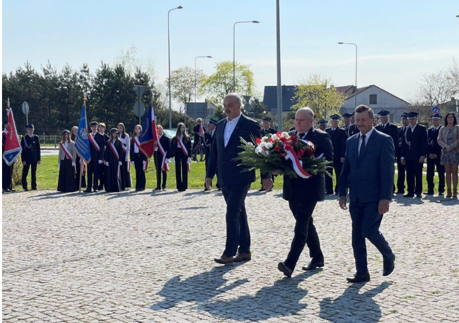
Zdjęcie 17. 3 maja 2022 r. - Złożenie kwiatów pod Obeliskiem w Starym Gostkowie