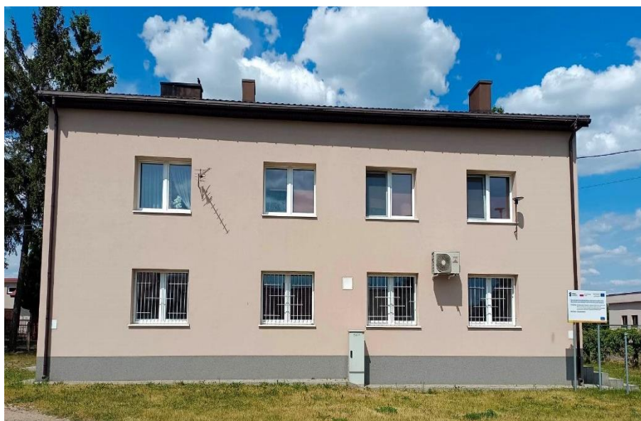
Zdjęcie 12. Budynek komunalny w Wartkowicach.

Docieplenie stropu, docieplenie ścian, docieplenie ściany na gruncie, wymiana drzwi zewnętrznych, wymiana okien drewnianych. Roboty towarzyszące w tym: demontaż i ponowny montaż elementów zamontowanych na elewacji, wykonanie opaski wokół budynku, rozebranie schodów zewnętrznych i wykonanie nowych, remont daszków nad wejściami, wymiana instalacji odgromowej, demontaż obróbek blacharskich i wykonanie nowych, przemurowanie i remont kominów, zamurowanie okienek piwnicznych.