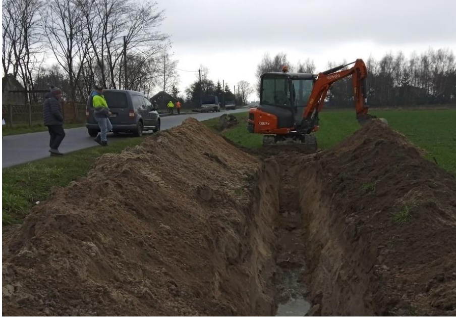
Zdjęcie 6. Budowa wodociągu Krzepocinek