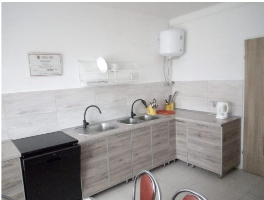
Zdjęcie 2. Kuchnia w OSP w Sędowie