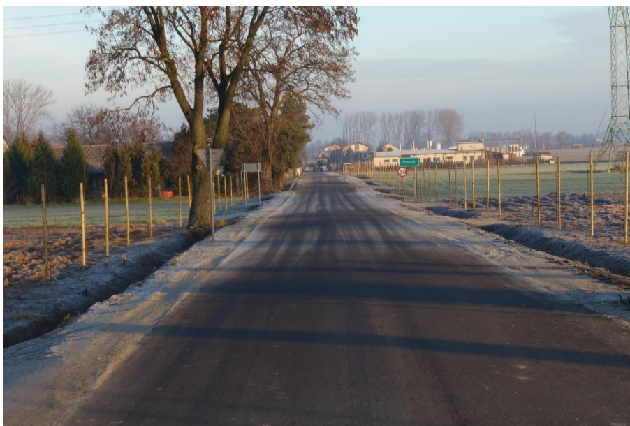
Zdjęcie 4. Droga gminna Plewnik Drugi - Ujazd

Zadanie zrealizowano przy udziale środków finansowych Rządowego Funduszu Rozwoju Dróg w wysokości 912.575,00 zł.