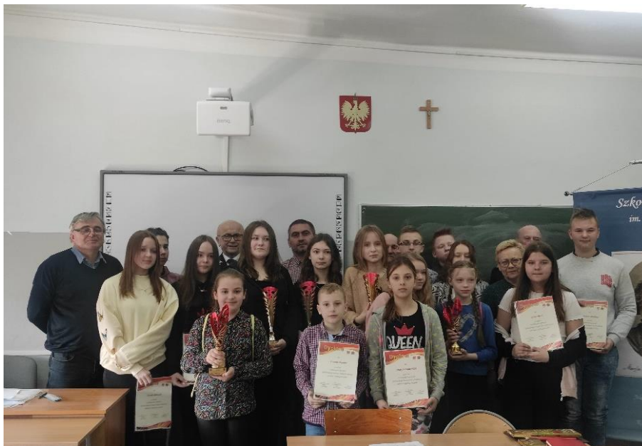
Zdjęcie 32. Uczestnicy konkursu „Młodzież zapobiega pożarom”