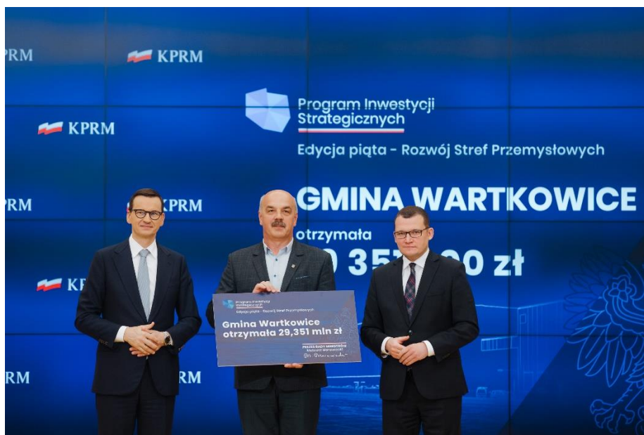
Zdjęcie 8. Uroczystość w KPRM