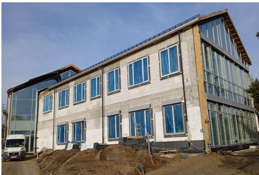
Zdjęcie 9. Budynek pasywny Urzędu Gminy Wartkowiec w trakcie budowy

Termomodernizacja budynków użyteczności publicznej i budynków mieszkalnych na terenie gminy Wartkowiec. Zadanie obejmowało następujące obiekty: