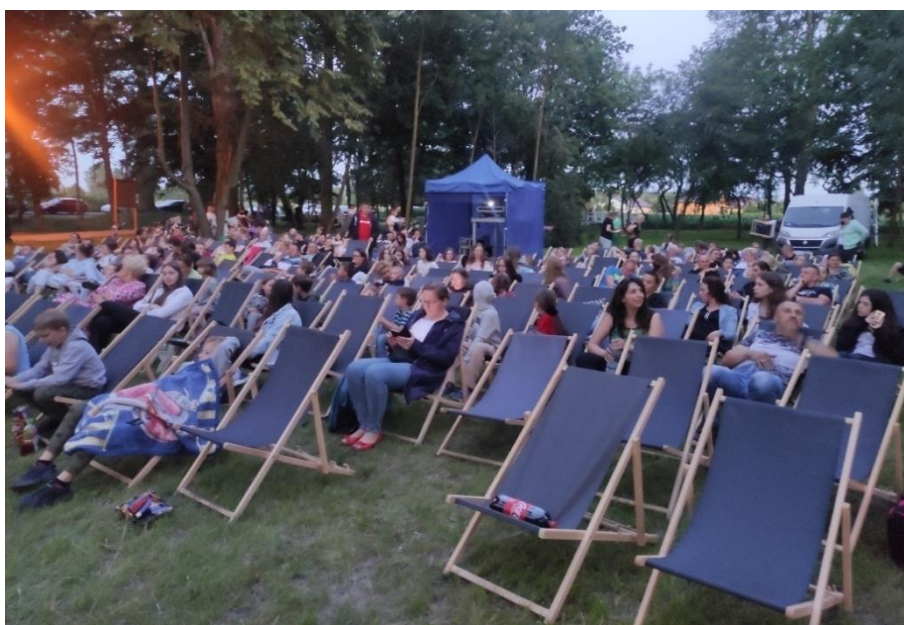
Zdjęcie 20. Kino plenerowe w parku w Nerze