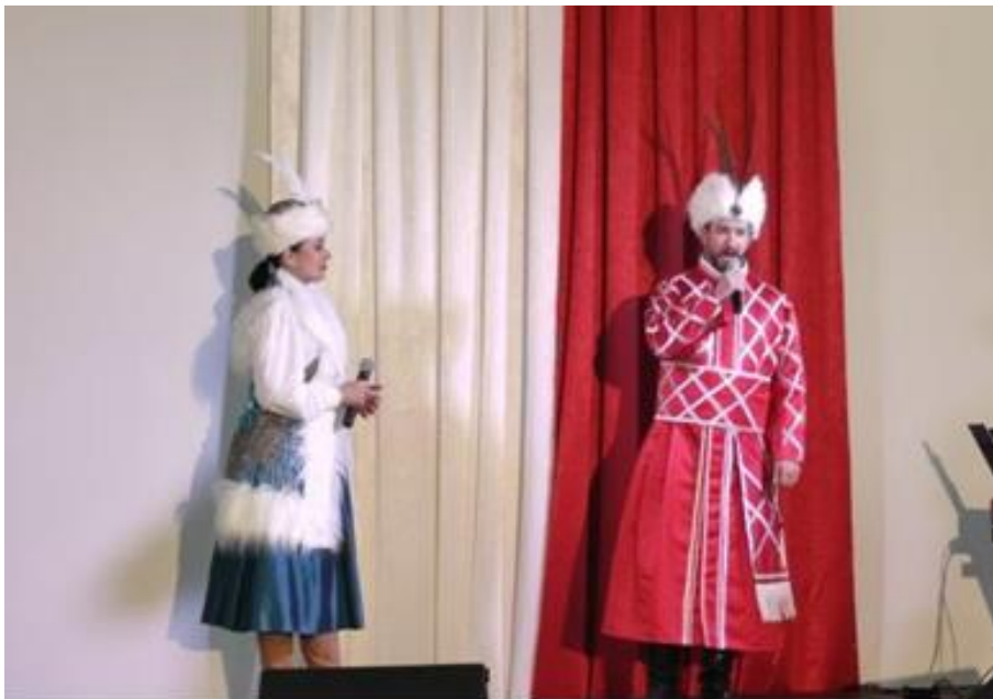
Zdjęcie 18. Koncert patriotyczny w OSP w Wartkowicach z okazji uchwalenia Konstytucji 3 Maja