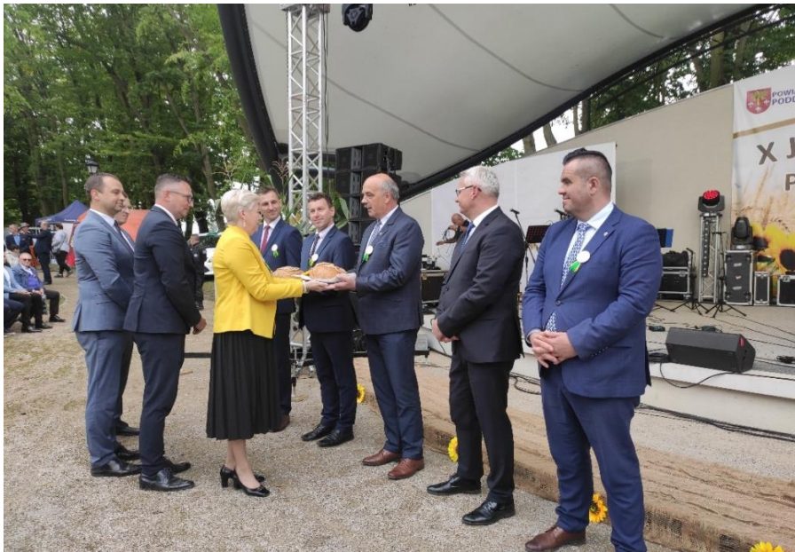
Zdjęcie 23. Dożynki Powiatu Poddębickiego w Zadzimiu