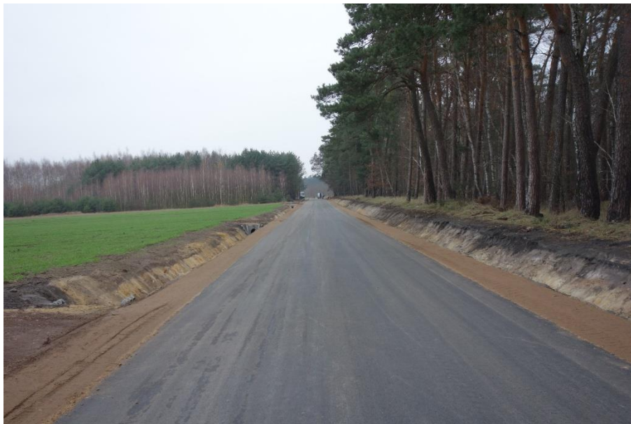
Zdjęcie 5. Droga gminna Chodów - Pelczyska

Na realizację pierwszego etapu Gmina otrzymała dofinansowanie Generalnej Dyrekcji Lasów Państwowej z funduszu leśnego w wysokości 2.893.900,00 zł.