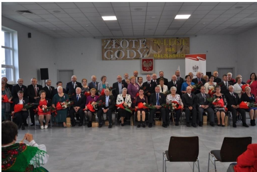
Zdjęcie 27. Obchody 50-lecia zawarcia związku małżeńskiego w Sali OSP w Wartkowicach