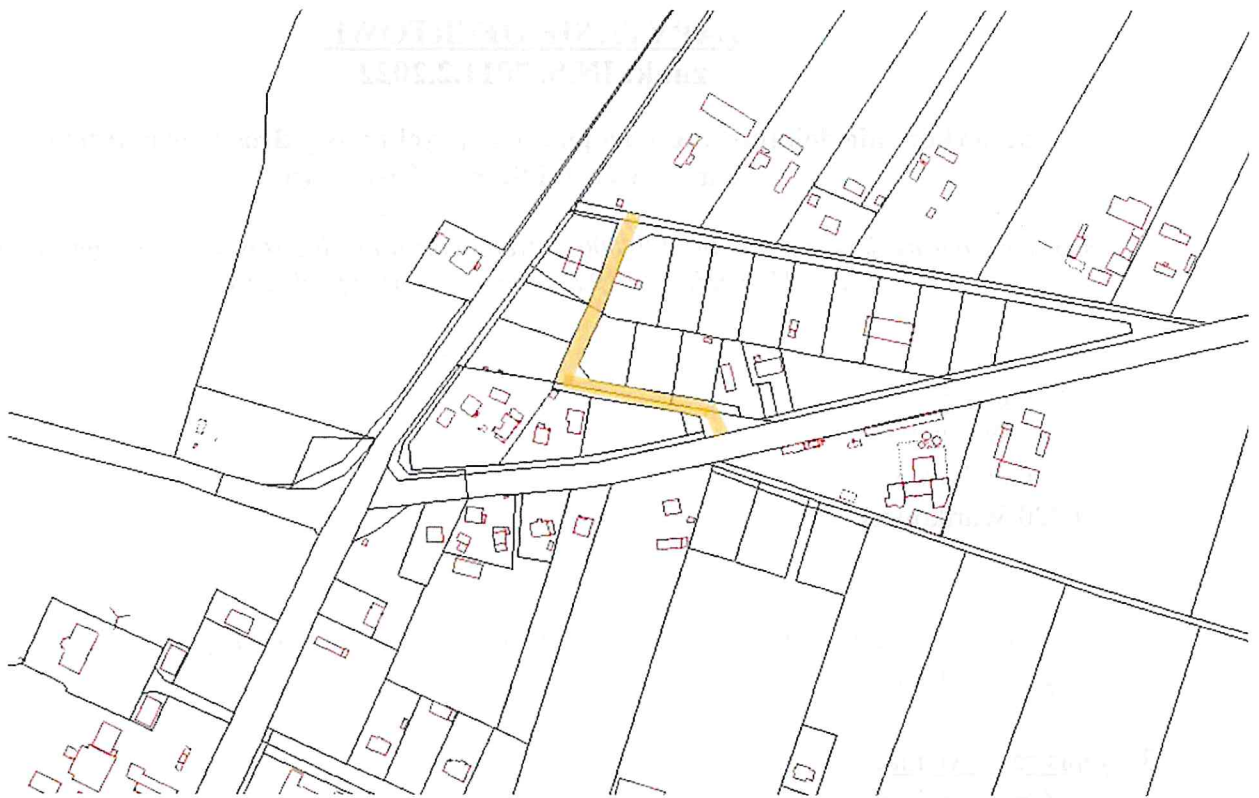
droga wewnętrzna w Starym Gostkowie